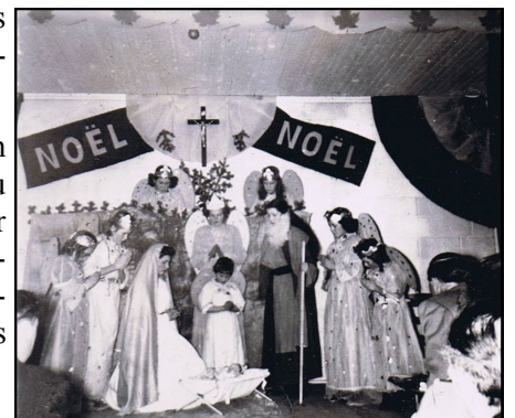
Tableau vivant à la salle municipale